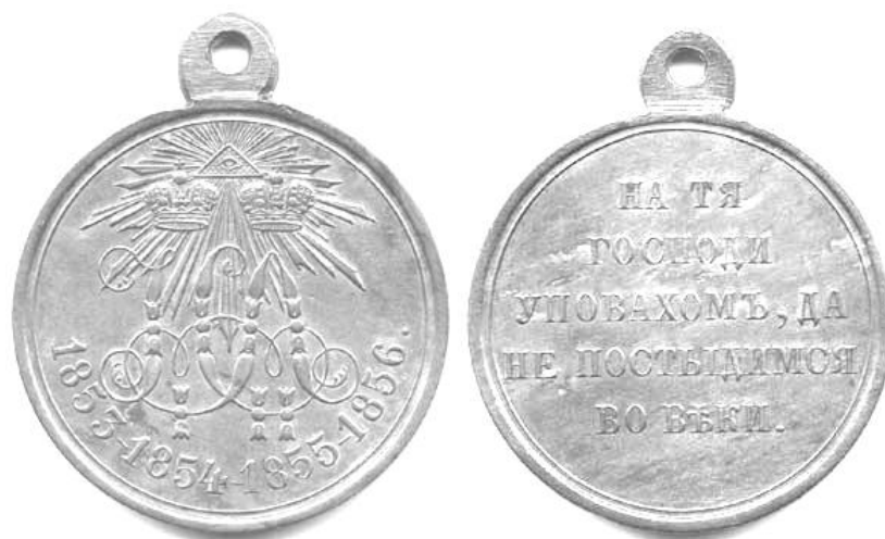
Медаль «В память Крымской войны 1853-1856»

А по окончании Крымской войны ему была вручена бронзовая медаль «В память Крымской войны 1853—1856»