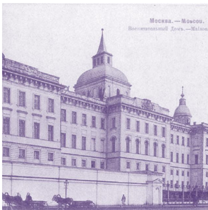
Московский Воспитательный Дом (Основатели Московского воспитательного дома — Императрица Екатерина II и генерал-поручик Иван Бецкой)