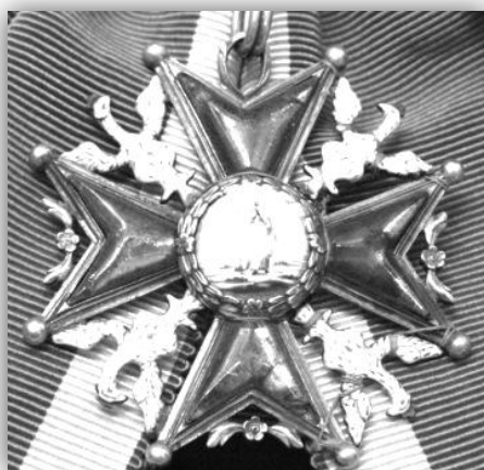
Орден св. Станислава 3-й степени.