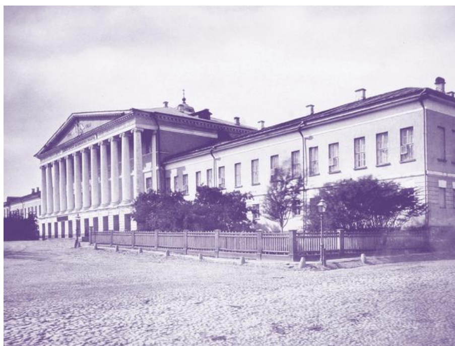
Императорская Екатерининская больница

Спустя год, 11 мая 1877 г. Романовский был выдвинут на должность старшего ординатора хирургического отделения Императорской Екатерининской больницы в Москве.