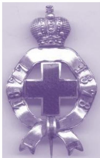
Знак «Красного креста»