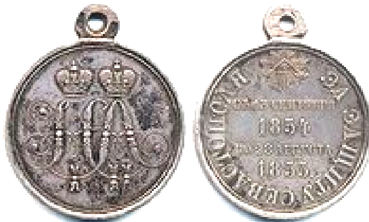
Медаль «За защиту Севастополя»