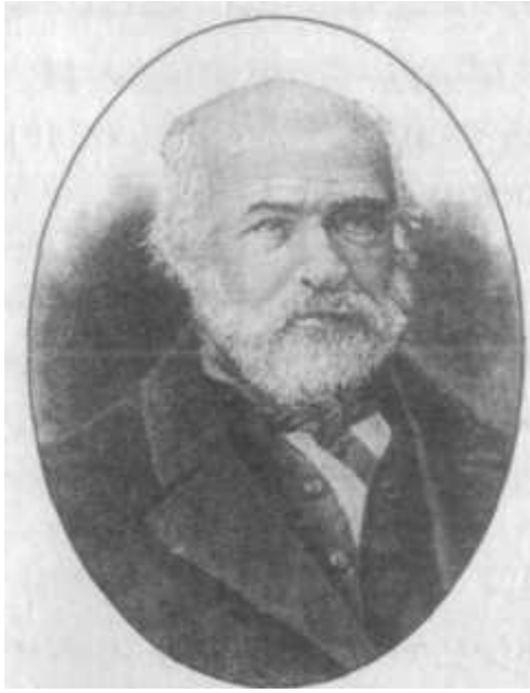
Пирогов Николай Иванович (1810-1881)